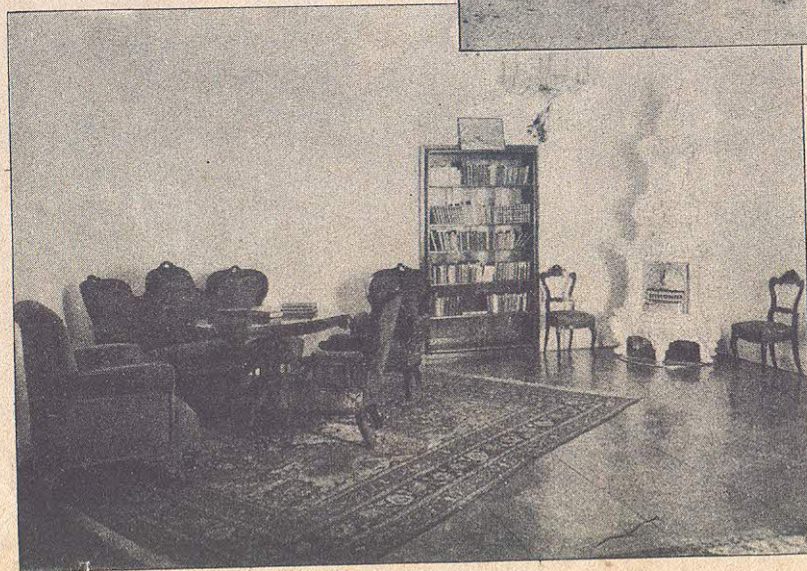
Salonek pana presidenta v Lánech.

dožívá se 7. března 82 let. V tento den provádí jej vroucí přání celého národa, aby zůstal ještě po mnohá léta vůdcem a osvícenou hlavou našeho státu v neztenčené svěžesti tělesné i duševní. — Náš obrázek zachycuje jej s jeho věrnou družkou, paní Charlotou G. Masarykovou.